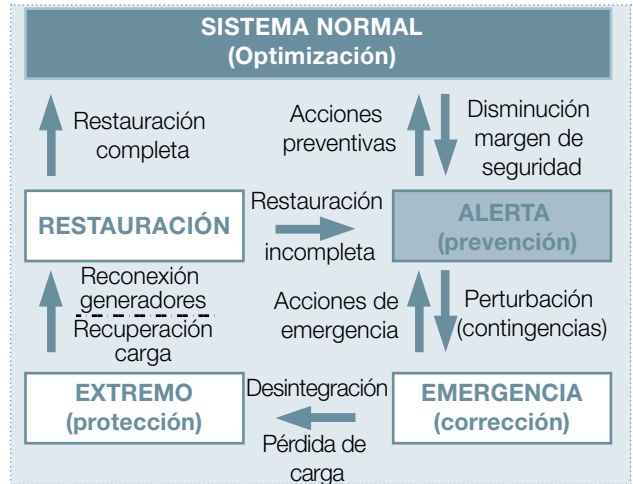
Figura 8. Posibles estados del sistema

Hasta aquí hemos visto las principales funciones que pueden presentar los centros de control. En la figura 9 representamos en un cuadro esquemático estas funciones indicando la rela- ción que existe entre ellas. En este esquema se han señalado las relaciones más evidentes ya que la información que pro-